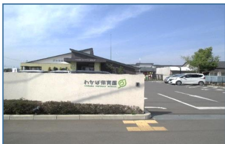
所在地 下野市下古山 3025-1

約束の時間に伺うと、園長先生が笑顔で迎えてくださいました。午睡の準備中でしたが、園長先生のご厚意で園内を見学させていただきました。すでに寝息をたてている乳児の姿や準備中の子どもたちからのかわいいご挨拶に、相好崩れっぱなしの私たちでした。